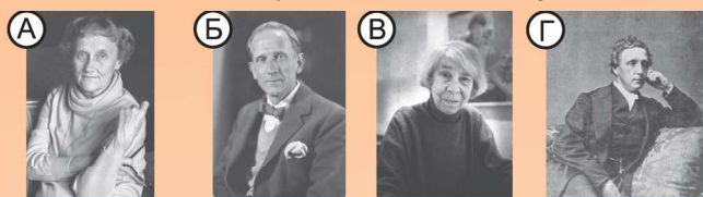
А. Линдгрэн А. Милн Т. Янссон Л. Кэрролл

10. Кто является автором книг о Винни-Пухе?